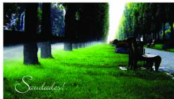
Folheto Projeto Bálsamo da União Centro-Oeste, Este e Central

Dia 2 de novembro comemoramos o Dia de Finados. A morte é um acontecimento muito triste e nem todas as pessoas sabem lidar com ela. Porém, para o jovem adventista a morte não é o fim, não é o