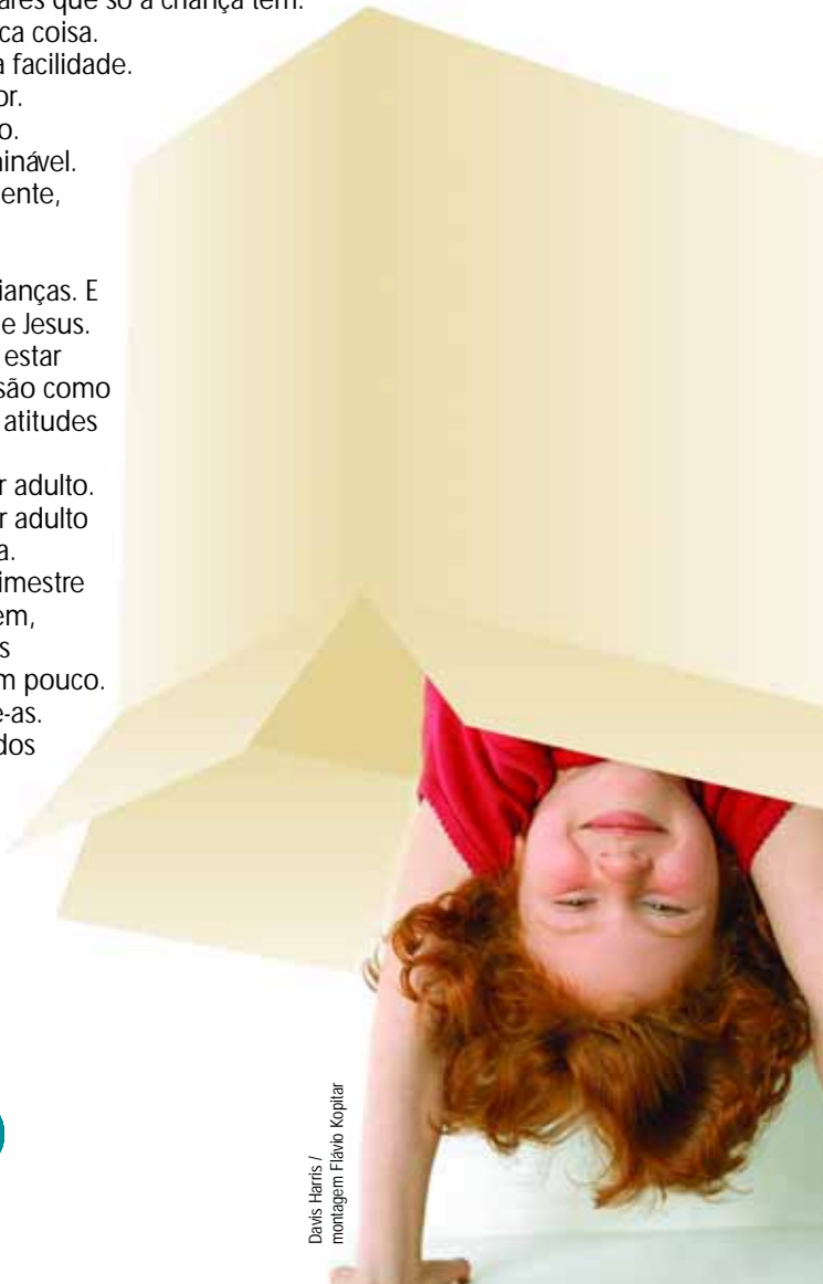
Davis Harris / montagem Flávio Kopitar